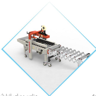
مناسب برای انبارش دینامیکی محصولات