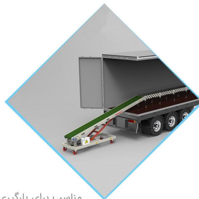
مناسب برای بارگیری و تخلیه