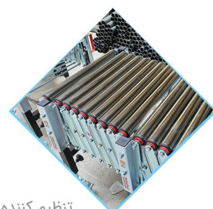
تنظیم کننده فاصله بین رولرها