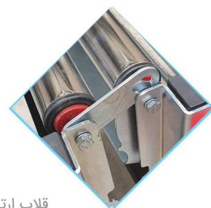
قلاب ارتباط نوار نقاله‌ها