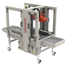
دستگاه با نوارنقاله‌های نیم متری