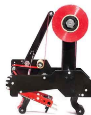
هد چسب زن