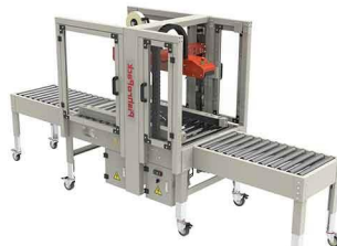
نوارنقاله‌های یک متری