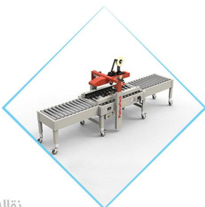
نقاله‌های یک متری