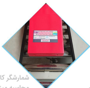
شمارشگر کارتن / محاسبه میزان چسب مصرفی