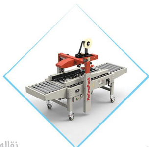
نقاله‌های نیم متری